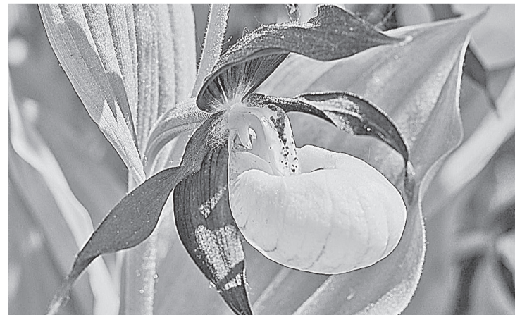
Венерин башмачок с берегов реки Мсты занесён в Красную книгу Новгородской области

Ботанический институт носит имя нашего земляка Владимира Леонтьевича Комарова, его детство и юность прошли в имении деда Ровное-Михайловское. На берегах горной Мсты он собрал свой первый гербарий, сделал первые открытия. В 1919 году исполняется 150 лет со дня рождения известного ученого. Хотелось бы, чтоб эту дату отметили не только в Санкт-Петербурге, но и в нашем городе.